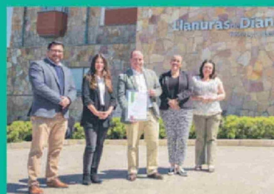
Hotel Llanuras de Diana de Caja Los Andes obtuvo el Sello S del Sernatur.

"Para una buena gestión sostenible no hay un único camino. Lo más importante es que la convicción en esta materia venga acompañada de beneficios tangibles para todos los grupos de interés, saliendo de lo discursivo e impulsando cambios desde la gobernanza, con iniciativas que se evalúen frecuentemente para proyectar una ruta a seguir", concluyó Zavala.