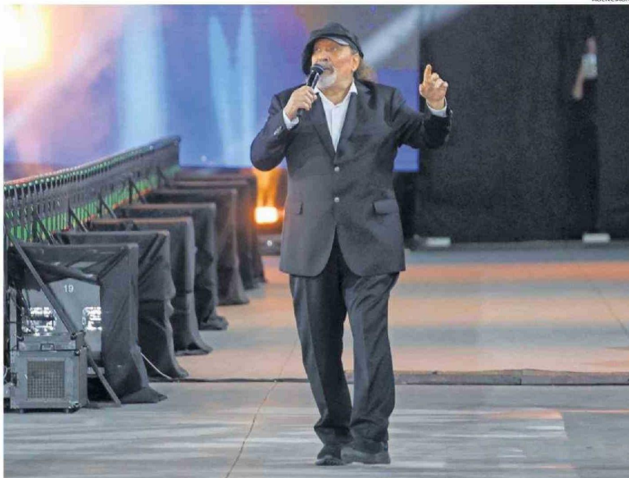
LA GALA DEL FESTIVAL DE VIÑA FUE LA ÚLTIMA APARICIÓN EN TELEVISIÓN DE MIGUEL PIÑERA LA SEMANA PASADA.

José Miguel Carlos Piñera Echeñique, el "Negro" (por ser el más moreno de sus hermanos), nació el 18 de octubre de 1954, quin-