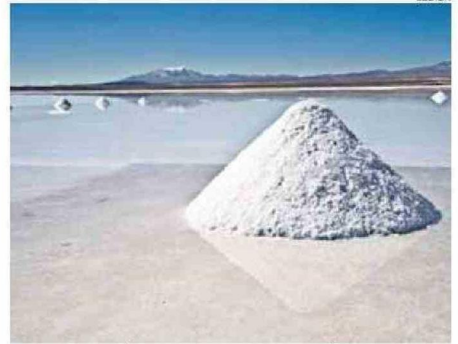
MINISTRA ENUMERÓ LOS INCONVENIENTES DE LA MOCIÓN PARLAMENTARIA.