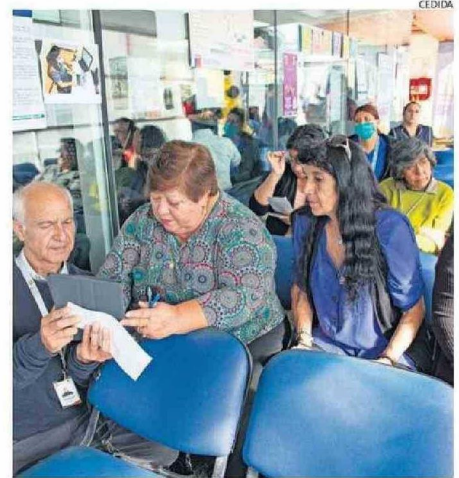
IMPLEMENTARON NUEVO SISTEMA.