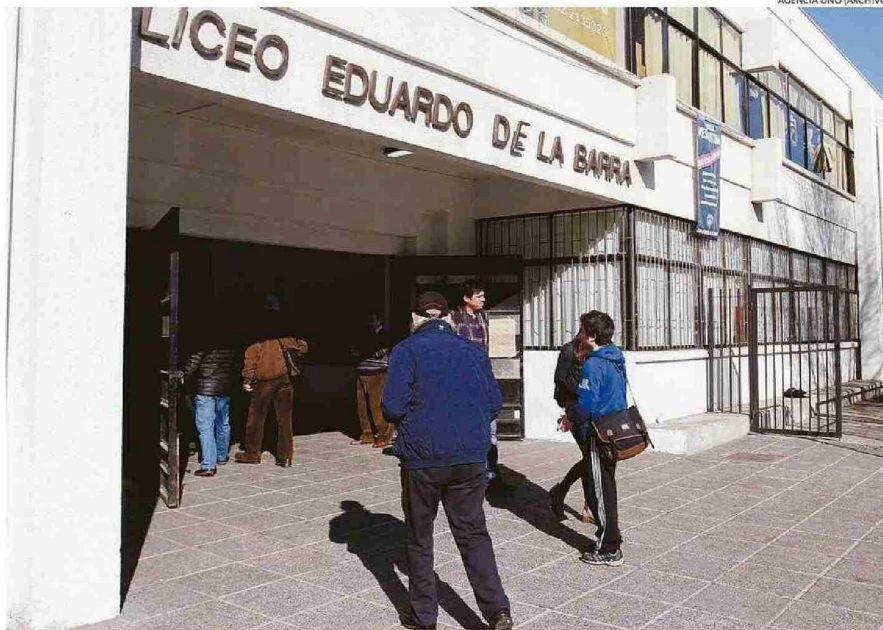
PRINCIPAL DESAFÍO DEL LICEO PORTEÑO, SEGÚN SU DIRECTORA, ES HACER PARTE A LAS FAMILIAS DE LAS TRAYECTORIAS EDUCATIVAS.

“Nuestros y nuestras estudiantes subieron mucho sus puntajes, así que estamos muy contentos, porque creemos que se empieza a consolidar un proceso postpandémico que nos costó mucho, con hartos rezagos a raíz de situaciones de salud mental, por lo tanto, no ha sido fácil retomar, sin embargo, hoy día estamos contentos con los resultados”, declaró la di-