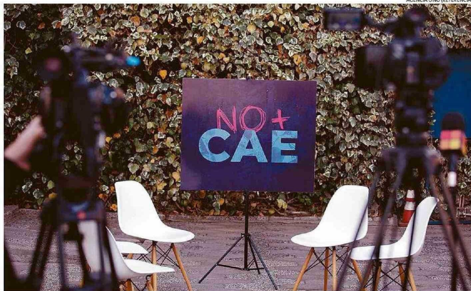
DESDE QUE SE CREÓ EL CRÉDITO CON AVAL DEL ESTADO, MÁS DE 1.200.000 PERSONAS, A NIVEL NACIONAL, SE HAN VISTO BENEFICIADAS.