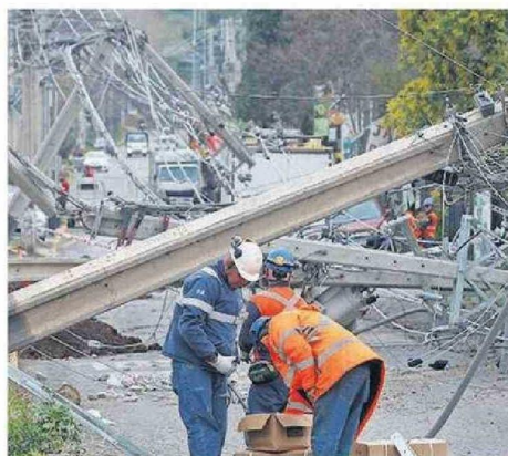
Producto de los vientos, se cayeron varios postes.