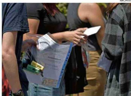
MILES DE ESTUDIANTES RINDEN EL EXAMEN.

invierno, hay directrices claras que pueden ayudar a tener un desempeño idóneo.