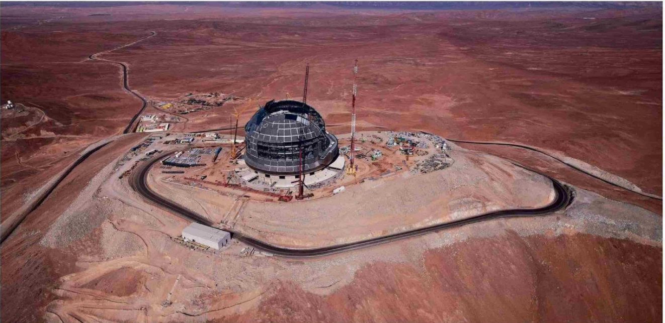
Se prevé que en 2028 esté listo el Telescopio Extremadamente Grande (ELT, por sus siglas en inglés), el que -entre otras cosas- buscará vida en el universo.

El también ex representante del Observatorio Europeo Austral (ESO en inglés) está convencido de que la construcción de este coloso de la astronomía, sumado a los observatorios ya existentes, permitirá la creación de actividades económicas que beneficien a las regiones receptoras de estos proyectos.