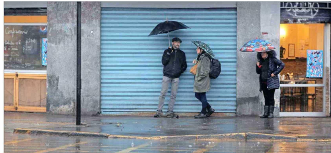
Intensas precipitaciones generan problemas en las ciudades, principalmente por falta de obras de evacuación de aguas lluvias que no se resolverán sin inversiones importantes, aseguran especialistas.

La Asociación Nacional de Empresas Sanitarias destaca a su vez que solo el año pasado la industria invirtió US$ 613 millones para producción, distribución y nueva infraestructura de agua potable que involucran desde embalses subterráneos bajo parques urbanos hasta desalación a