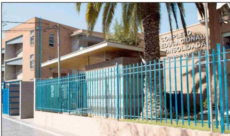
Complejo Educacional Consolidada actualidad

Sin embargo, es en 2003, cuando se crea el Proyecto de Fusión de los dos establecimientos, aprobado por el Decreto de Fusión N° 742 del Ministerio de Educación, dando origen al Complejo Educacional Consolidada de Puente Alto, que en 2024 cumplió 126 años educando a generaciones de estudiantes puentealtinos.