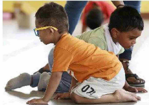
Se recomienda fomentar las actividades al aire libre para así conseguir una mayor exposición a la luz natural y un mayor desarrollo de la visión a larga distancia, lo que puede ayudar a prevenir la aparición de la miopía

De ahí la importancia de poner freno al crecimiento acelerado del ojo durante la infancia, que, por lo general, suele estabilizarse entre los 20 y los 25 años. No obstante, la carencia de un control temprano de la miopía