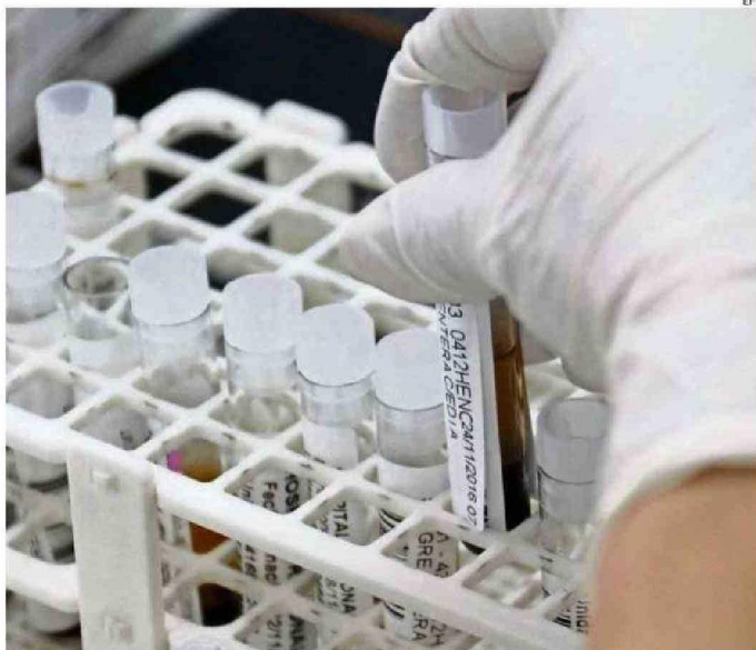
LA REGIÓN ES DISÍMIL EN CUANTO A CONFIANZA EN LA CIENCIA: BOLIVIA FUE PENÚLTIMA EN LA MEDICIÓN.