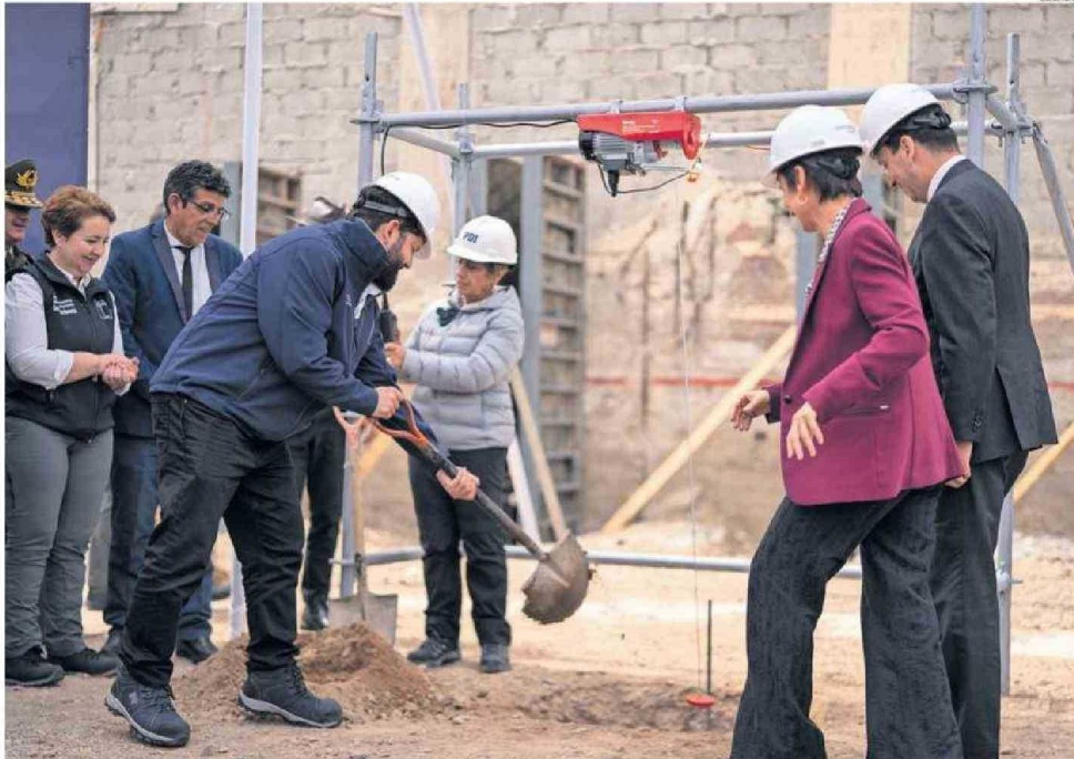
EN TOCOPILLA EL PRESIDENTE BORIC COLOCÓ LA PRIMERA PIEDRA PARA EL FUTURO CUARTEL DE LA POLICÍA DE INVESTIGACIONES EN EL PUERTO.