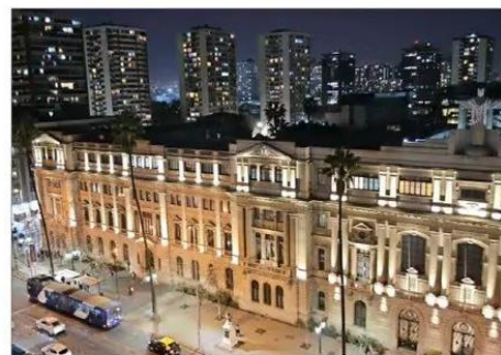
La Pontificia Universidad Católica se mantuvo como el plantel preferido por los puntajes nacionales.

guen siendo un poco más bajos que los del año pasado, porque tuvimos menos inscritos, pero no menos postulantes ni selección, sino que dentro de este contexto hubo un sistema más eficiente, con mejor participación".