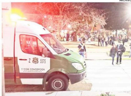
CARABINEROS REALIZANDO PATRULLAJES EN EL LUGAR.