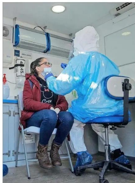
CONTAGIO. Según el último informe epidemiológico, Las Condes registra una tasa de 9,2 casos activos por 100 mil habitantes.

"Hasta el momento ha habido un avance positivo, en general, salvo algunas comunas. Melipilla, La Florida y Maipú, que están en Transición, mejoraron bastante y quizás por ahí puede haber un cambio", adelanta el ministro Paris.