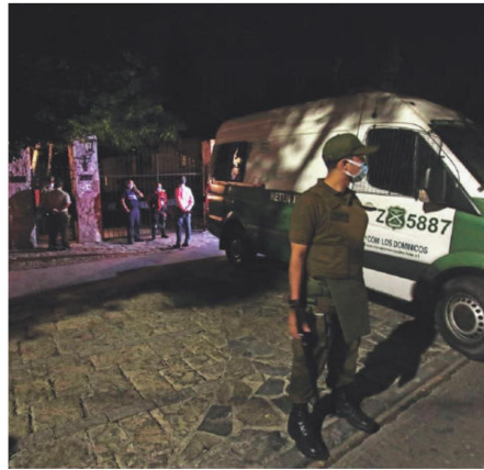
Las Condes es una de las comunas que aporta con más “fiesteros”.