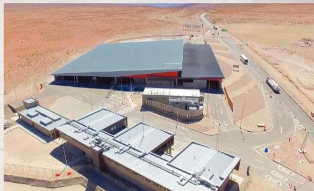
El Paso Chungará.

Los organismos presentes en el complejo fronterizo son el Servicio Nacional de Aduanas, la Policía de Investigaciones, el Servicio Agrícola y Ganadero (SAG) y Carabineros. Y es utilizado en su gran mayoría por chilenos y peruanos debido al convenio Arica-Tacna, que permite el paso entre ambas ciudades utilizando solamente la cédula nacional de identidad.