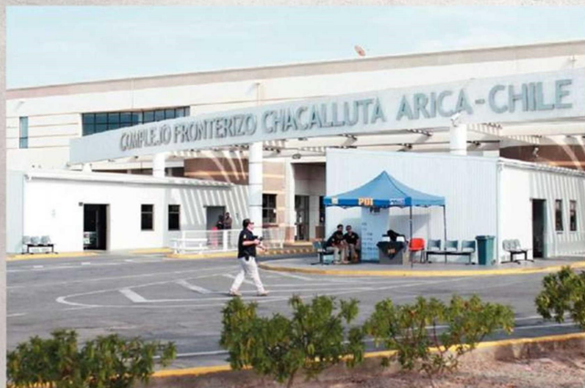
El complejo fronterizo Chacalluta.