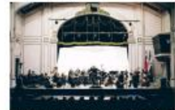
En 2022 la Orquesta Clásica Usach vuelve a tener público en el Teatro Aula Magna Usach.