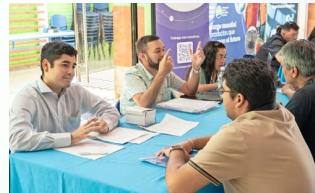
Las ferias laborales están entre las instancias que conectan a la comunidad con las oportunidades en el sector.

tarapaqueños. Además, junto a comunidades y organizaciones locales, la compañía desarrolla programas productivos y sociales, contando hoy con más de 400 proyectos en ejecución.