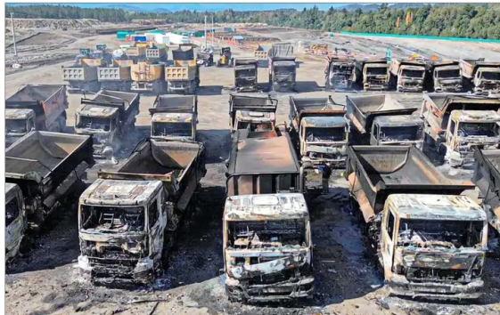
Doce fueron los encapuchados que, armados, irrumpieron en la madrugada de ayer en la zona donde estaban aparcados los camiones. Allí redujeron a los guardias, prendieron fuego a los vehículos —entre ellos, uno con combustible— y huyeron.

Los 48 vehículos de carga incendiados eran parte de las obras de la central hidroeléctrica Rucalhue, en la que China International Water & Electric Corp está invirtiendo US$ 350 millones.