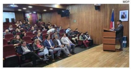
EN EL MARCO DEL PLAN DE INVIERNO EL SEREMI POZA ASEGURÓ LA PRESENCIA DE UN IMPORTANTE NÚMERO DE EQUIPOS Y PERSONAL HUMANO.