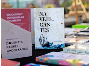
Ediciones USS también estuvo presente en la feria.