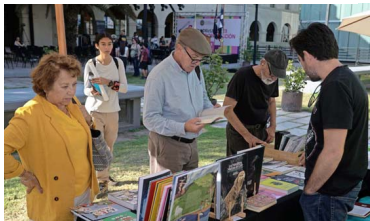
Más de 40 editoriales estuvieron presentes con sus títulos. Los vecinos de Providencia tuvieron acceso a descuentos especiales.