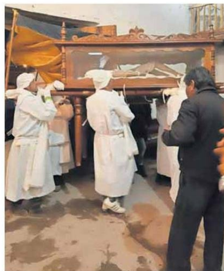
LA PASIÓN DEL SEÑOR ES UNA DE LAS ACTIVIDADES MÁS SIMBÓLICAS.

El Jueves Santo, se conmemora la Última Cena, donde Jesús instituye la Eucaristía y el sacerdocio. A las 21 horas se realizará la Santa Misa de la Cena del Señor, que incluye el lavatorio de los pies, acto que recuerda el gesto de humildad de Cristo hacia sus discípulos. Posteriormente, tendrá lugar la Procesión del Encuentro, una tradición que representa al apóstol San Juan corriendo para avisar a la Virgen María que