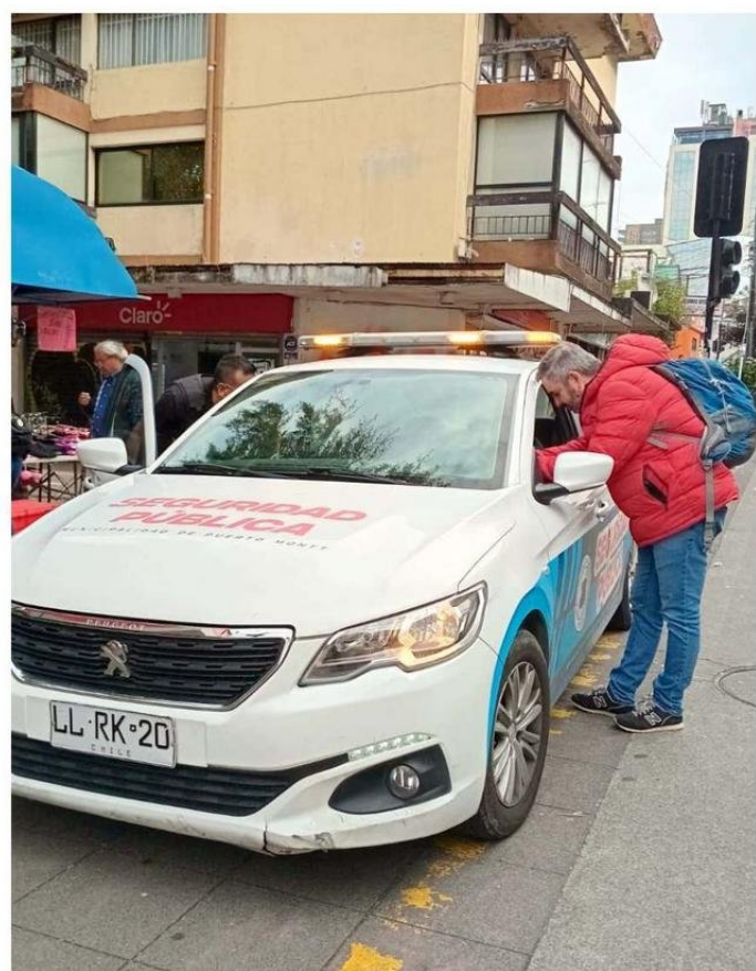
LA SEGURIDAD CIUDADANA ES UN ASPECTO QUE EL ALCALDE BUSCA POTENCIAR EN PUERTO MONTT.

quier minuto puede cambiar". Destaca también algunas medidas adoptadas por su administración desde que asumió el 6 de diciembre de 2024, como el aplicar la ordenanza contra el comercio ambulante, el término de los túneles "de la muerte" que estaban ubicados en las inmediaciones del Terminal de Buses y la plaza Camahueto, y la generación de la primera Unidad Penal Municipal (UPM) a cargo del ex fiscal regional, Marcos Emilfork, entre otras acciones. También resalta las intervenciones artísticas y culturales que se desarrollan en la plaza de Armas (conciertos a las 17:00 horas de los domingos) y en la escalera de calle Rancagua, con la finalidad de recuperar espacios públicos. Mencionó esfuerzos similares aplicados a los paraderos.