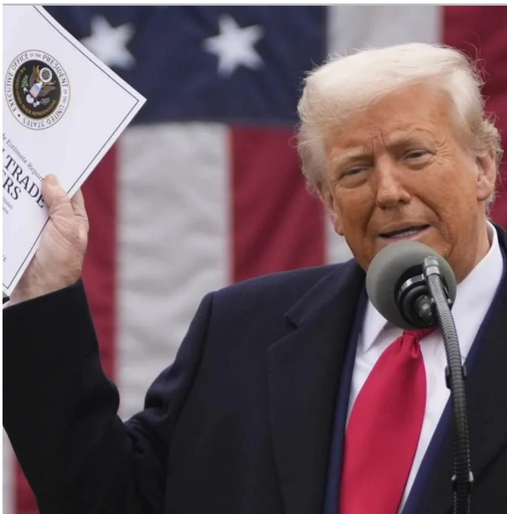
El presidente de Estados Unidos, Donald Trump.

Se trata además de la octava caída consecutiva para el precio de la libra, periodo en el que acumula una baja de 12,82%.