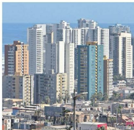
CAPITAL REGIONAL PASÓ DE 20,2% A 24,0% EN EL ÚLTIMO CENSO.

Dijo que este escenario se ha visto influenciado por factores como la mayor independencia de las personas o bien la poster-