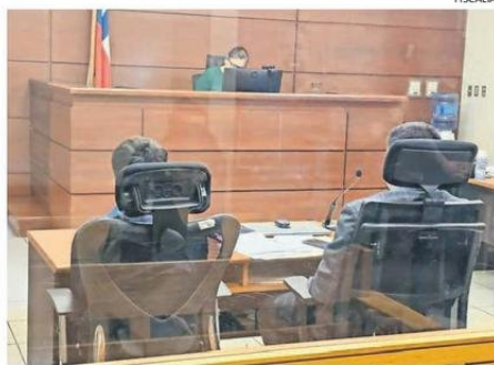
EL JOVEN QUEDÓ CON PROHIBICIÓN DE ACERCARSE A LA UCN.

“Hasta el día de ayer (lunes) se efectuó inteligencia investigativa, inteligencia policial y diligencia informática que permitieron finalmente llegar al presunto autor de este hecho, a raíz de lo cual se tramita la orden de detención por intermedio del Ministerio Público y Juzgado de Garantía y una