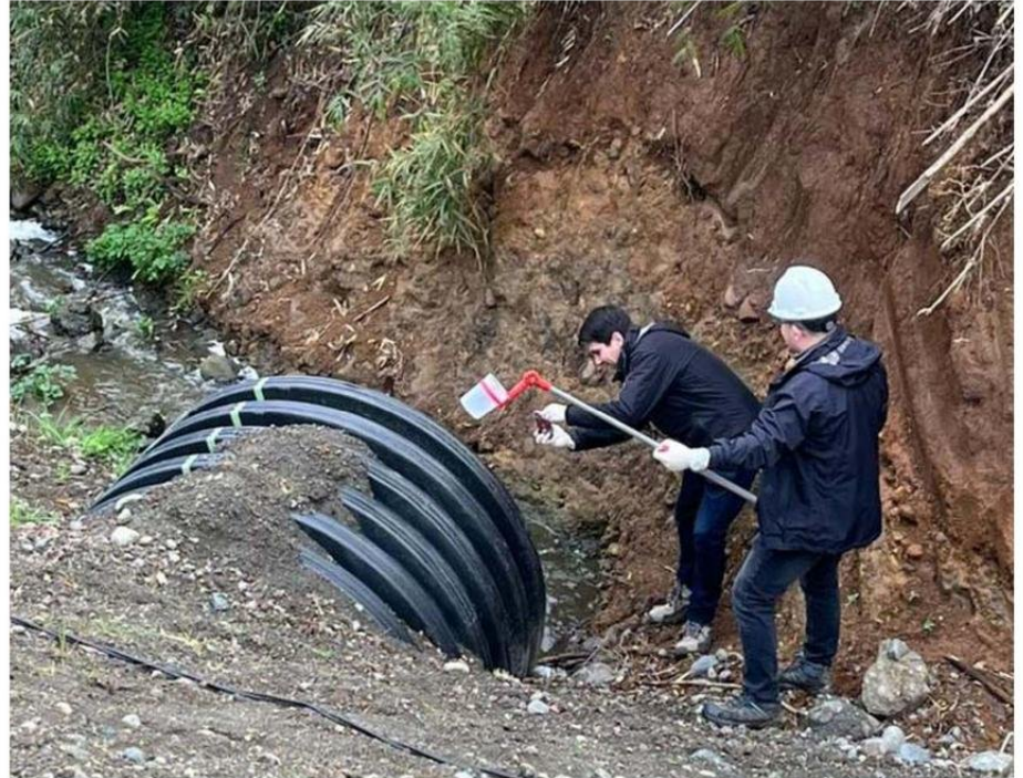
LA UNIDAD DE AGUAS REALIZÓ UN EXHAUSTIVO TRABAJO QUE LOGRÓ DAR CON LOS RESPONSABLES DE LA CONTAMINACIÓN DE AMBOS ESTEROS.

En relación a la denuncia por contaminación del estero El Molino II, desde la Seremi de Salud se indicó que en la misma fecha del anterior, la Unidad de Aguas visitó el lugar, no encontrando en esa oportunidad indicios de contaminación, debido a que la denuncia se hizo en una fecha posterior al 29 de septiembre, día que se produjo el derrame.