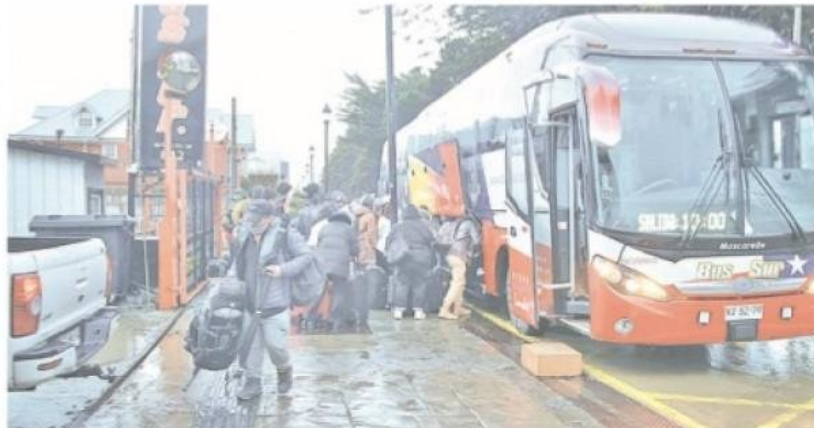
La falta de un rodoviario en la ciudad conlleva a que los pasajeros desciendan de los buses frente a las oficinas de las empresas que cumplen los servicios de transporte interprovincial e internacional.

La congestión de cada fin de semana largo, en verano, hacia