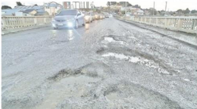
El puente Zenteno estaría listo en 2031 y se gastarían $3 mil 800 millones.

A parte de los caminos internos del Parque Nacional Torres del Paine, la comuna del mismo nombre, con estos recursos construirá su edificio consistorial en villa Cerro Castillo y un museo paleontológico. En tanto, Timaukel invertirá también en su edificio consistorial.