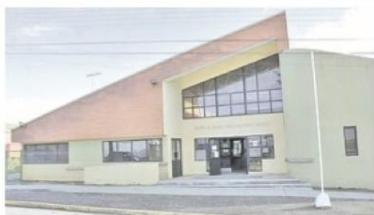
El consultorio Juan Lozic de Natales se remodelaría completo en caso que los cores den el visto bueno a la cartera de proyectos de Zonas Extremas.

Entre las iniciativas figuran el mejoramiento del sistema de alcantarillado y tratamiento de aguas servidas; la finalización del muelle multipropósito; un puerto seco para la ciudad; la