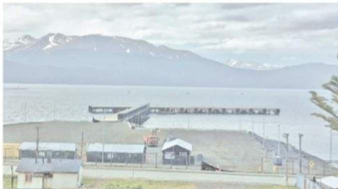
Se finalizaría la tercera etapa del muelle multipropósito de Puerto Williams.