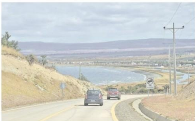
Se proyecta que la Ruta 9 Sur, hasta Agua Fresca, sea ensanchada.