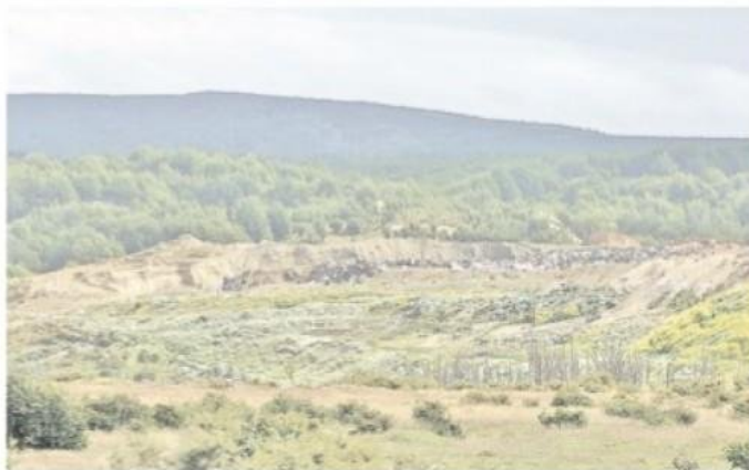
El vertedero municipal de Punta Arenas podría ser cerrado y concretarse el Centro de Gestión de Desechos Domiciliarios de Magallanes.

ría de la capital provincial de Última Esperanza. Se gastarán $2 mil 400 millones.