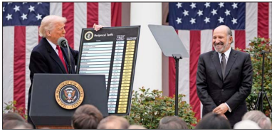
Donald Trump sostuvo durante el anuncio una tabla con el detalle de tarifas para 25 países, entre los cuales está Chile, acompañado del secretario de Comercio, Howard Lutnick.

tendrán aumento de aranceles. Una de los más significativos es el impuesto a la Unión Europea, de 20%. China tendrá una sobretasa de 34%.