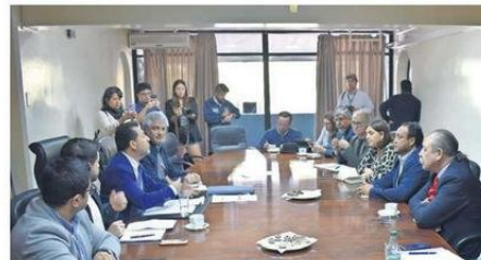
SEIS ALCALDES CONOCIERON EL LUNES DETALLES DEL PROYECTO.