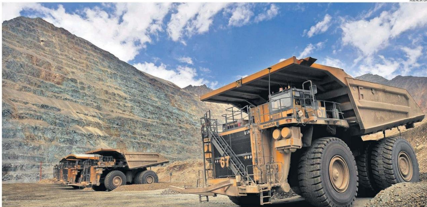
LOS FONDOS DEL ROYALTY BENEFICIARÁN A 12 MILLONES DE PERSONAS Y SERÁN ENTREGADOS AL 90% DE LAS MUNICIPALIDADES.