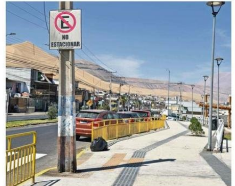
MUNICIPIO HIZO UN LLAMADO A DENUNCIAR ESTOS HECHOS