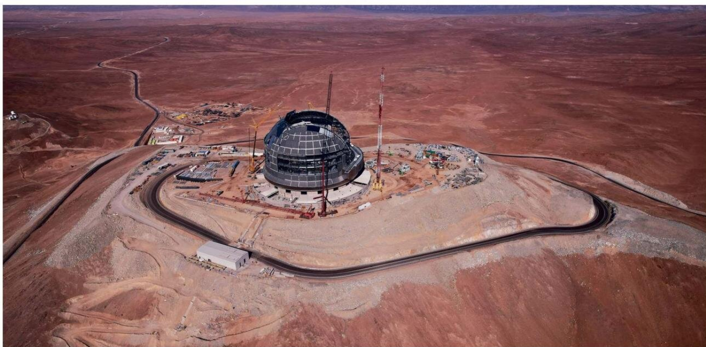
Se prevé que en 2028 esté listo el Telescopio Extremadamente Grande (ELT, por sus siglas en inglés), el que -entre otras cosas- buscará vida en el universo..

El también ex representante del Observatorio Europeo Austral (ESO en inglés) está convencido de que la construcción de este coloso de la astronomía, sumado a los observatorios ya existentes, permitirá la creación de actividades económicas que beneficien a las regiones receptoras de estos proyectos.