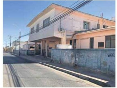
LOS COSTOS DE LA DEMOLICIÓN AÚN NO ESTÁN DEFINIDOS POR EL SSA.

Además, el Servicio de Salud informó que "el valor-coste final resultará al momento del desarrollo de la aprobación