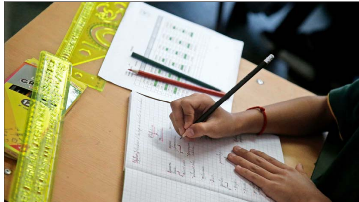
ESTRATEGIA.— El Mineduc ha señalado que busca reincorporar a los escolares que están con inasistencia grave mediante equipos de profesionales que los visitan y monitorean.

a los esfuerzos pospandemia, la inasistencia sigue siendo grave, por ser alta y permanente”.