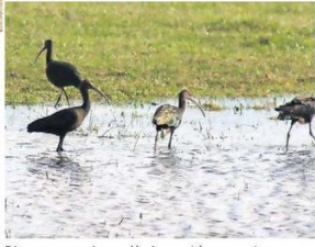
Diversas especies endémicas están presentes.

Zona de borde costero: corresponde a la concesión marítima. Se puede instalar equipamiento deportivo con enfoque en deportes náuticos.