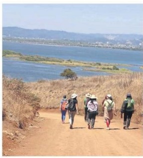
La zona es un lugar ideal para amantes de lo natural.

“Emplazamos al Estado de Chile a que se haga cargo y adquiera este espacio (fundo Ramuntcho) para convertirlo en un área efectivamente protegida, en que podremos desarrollar proyectos de ecoturismo, de educación medioambiental y de esparcimiento para toda nuestra comunidad.”