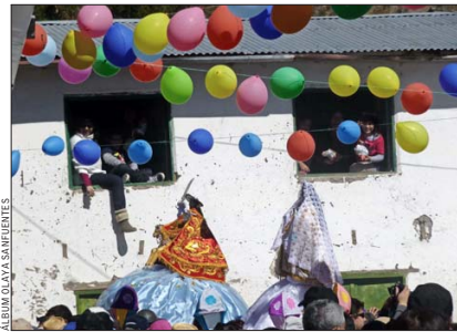
Figuras de Santiago y la Virgen en procesión el día 25 de julio, en Belén (Chile).

“Fueron muchos años de investigación. Fui a Bolivia, a muchas iglesias del altiplano boliviano, a la Paz, Sucre y Potosí, a Lima, Cuzco, Argentina y al norte de Chile. Fue una labor bien exhaustiva de trabajo de campo y de fuentes. El libro es una invitación también a mirar las imágenes y a tener una postura crítica frente a ellas. Creo, además, que este libro enseña a mirar y a darse cuenta que muchas veces hay arquetipos que nos rodean, a los que estamos acostumbrados, pero no reparamos en ellos. Santiago como héroe derrotando al enemigo es un arquetipo y va a seguir repitiéndose siempre, cada vez que surja la necesidad de mostrar la figura de alguien que nos ampare. Tengo muchas fotos y traté de seleccionarlas pensando en que estuvieran presentes los distintos países andinos que eran parte de mi pesquisa, pero también para mostrar que en ese mundo no existen los límites territoriales, porque el apóstol Santiago le pertenece a todo el mundo andino. Luego traté de que hubiera distintos soportes, que se viera que no solo está en la pintura sino en pequeñas imágenes, medallitas, esculturas chicas y grandes, en grabados, en un latón e incluso un tatuaje”.