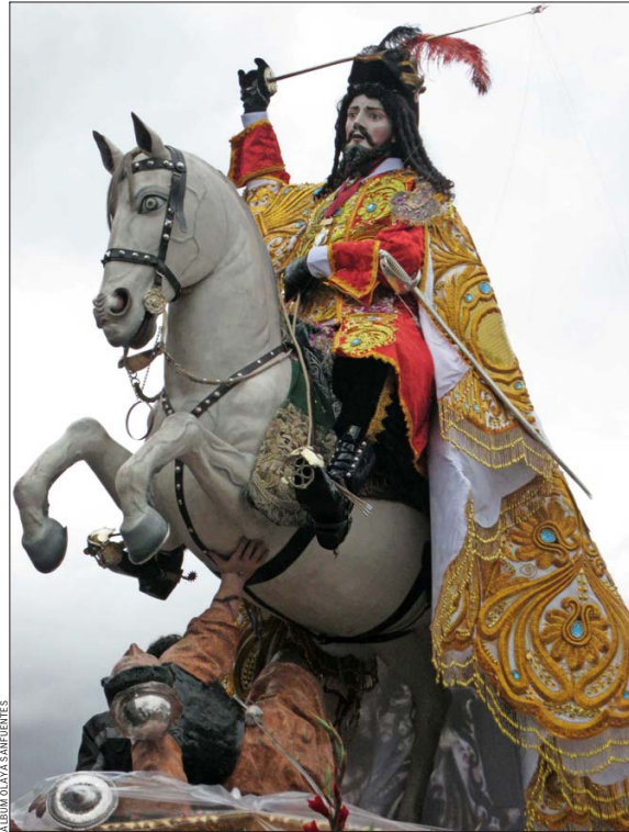
Santiago “Matamoros”, escultura cuzqueña del apóstol en la fiesta de Corpus en Cuzco. Se ve la predominancia de este Santiago guerrero, frente al peregrino y apóstol de Cristo.

ra y lo consideran, hasta el día de hoy, su patrono. Tal como lo consigna Olaya Sanfuentes, el inca Garcilaso de la Vega se refirió a él como “el divino Apóstol Santiago” y Guamán Poma de Ayala lo llamó “Santo Santiago el mayor, apóstol de Jesucristo” y le dedicó una imagen en su crónica.