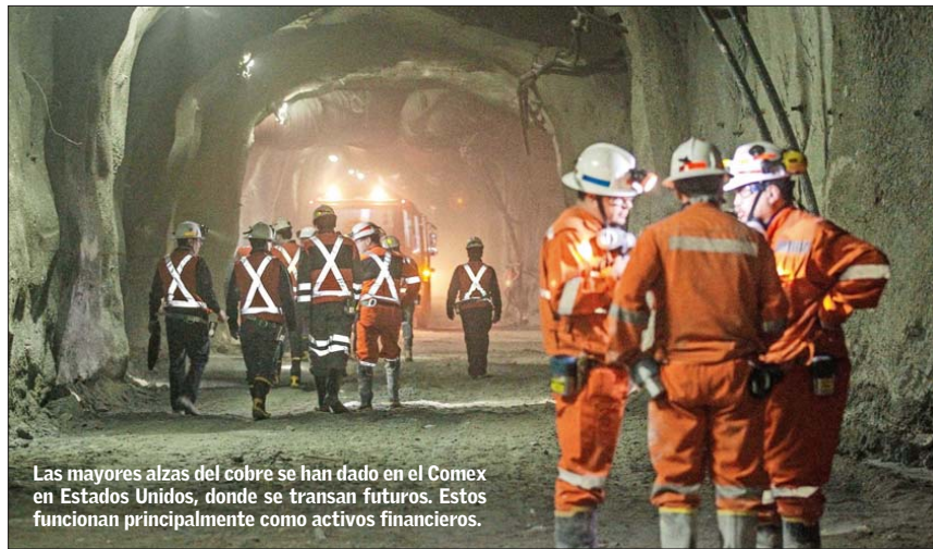
Las mayores alzas del cobre se han dado en el Comex en Estados Unidos, donde se transan futuros. Estos funcionan principalmente como activos financieros.

“No es extraño que los precios más altos del cobre se han dado con el dólar depreciado. ¿Por qué ocurre eso? En primer lugar, el cobre se consume en zonas de alto dólar. Solamente el 7% de la de-