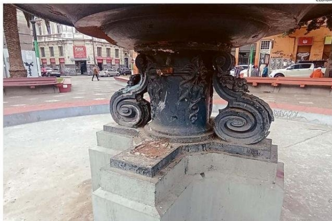
ESTRUCTURA HOY SE ENCUENTRA EN ESTE ESTADO: DESPRENDIMIENTO QUEDÓ A LA VISTA.

“Desapareció un ornamento de la pileta de Plaza Echaurren. La pileta es de fines del siglo XIX y vino a reemplazar a una más rústica que había; no sé en qué momento, pero fue dañada y la quebraron desde su base, más o menos en la década del 50’ o 60’. Producto de ello, la reconstruyeron con la que estaba