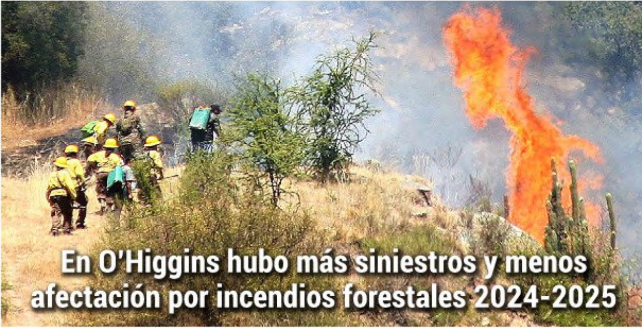
La región de O'Higgins ocupa el sexto lugar a nivel nacional en la ocurrencia de incendios forestales.