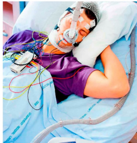
EL PODCAST DEL COMPLEJO ASISTENCIAL está disponible en Spotify como "Hagamos Salud CAVRR".

En la misma línea, el neurólogo especificó cómo afecta al cuerpo el no cumplir con las