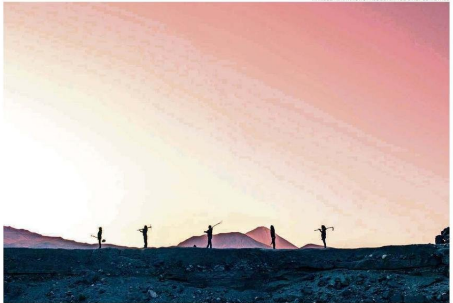
MANUELA MARTINOVA/PRODUCTORA DE CINE POETASTROS

tado en su día a día diferentes trastornos debido a la escasez hídrica para el consumo de agua y sus usos de subsistencia”, sostuvieron en un comunicado.