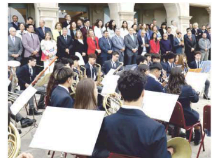
Comunidad educativa y banda sinfónica juvenil de la Escuela Experimental Jorge Peña Hen.