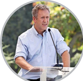
Juan Carlos Muñoz, ministro de Transportes y Telecomunicaciones.