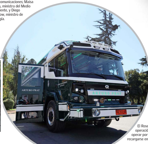
El Rosenbauer RTX es el primer carro bomba eléctrico en operación en Latinoamérica. Su sistema híbrido le permite operar por más de cuatro horas y sus baterías pueden recargarse en solo 45 minutos.