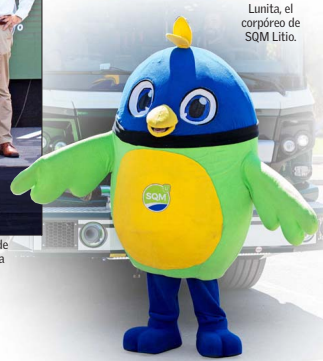
Lumita, el corpóreo de SQM Litio.