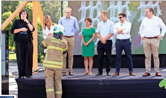
Representantes de SQM Litio y Copec y autoridades recibieron de un voluntario de Bomberos la pitón que simboliza la posta por la electromovilidad.