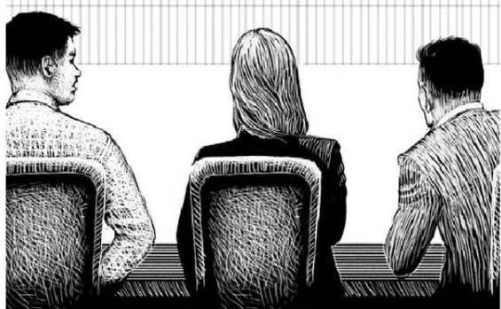
ILUSTRACIÓN: RAFAEL EDWARDS