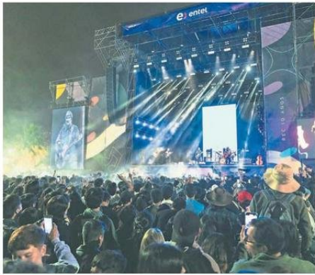
PERSONAS SE QUEDARON HASTA EL FINAL DEL EVENTO.