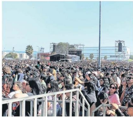
DESTACARON COMPORTAMIENTO DEL PÚBLICO.