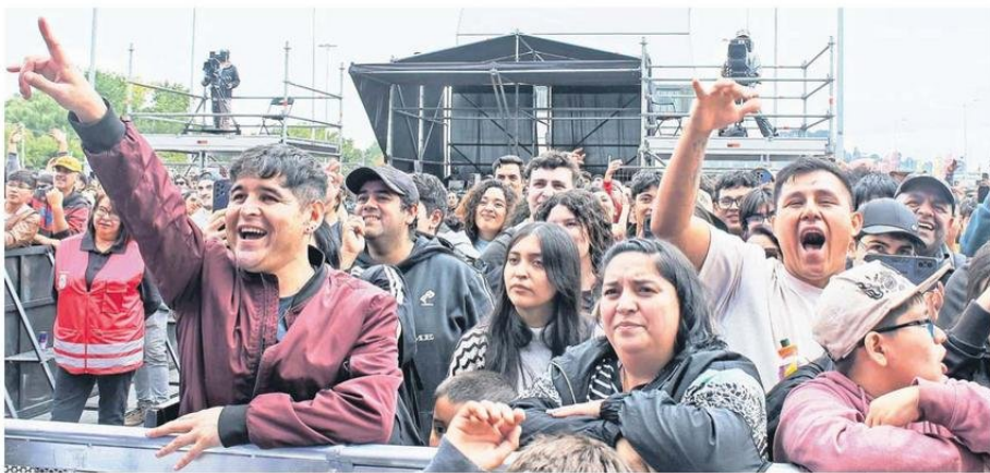
PÚBLICO DISFRUTÓ CON LOS SHOWS EN LOS DIFERENTES ESCENARIOS QUE OFRECIÓ EL REC.