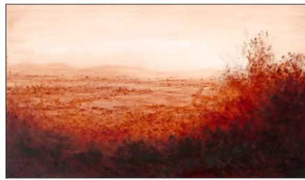
El paisaje fue su constante. Acrílico sobre tela, 2014.