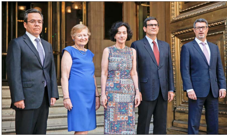
Desde mediados de diciembre de 2024 que el Consejo del Banco Central fijó la Tasa de Política Monetaria en el nivel actual de 5% anual.